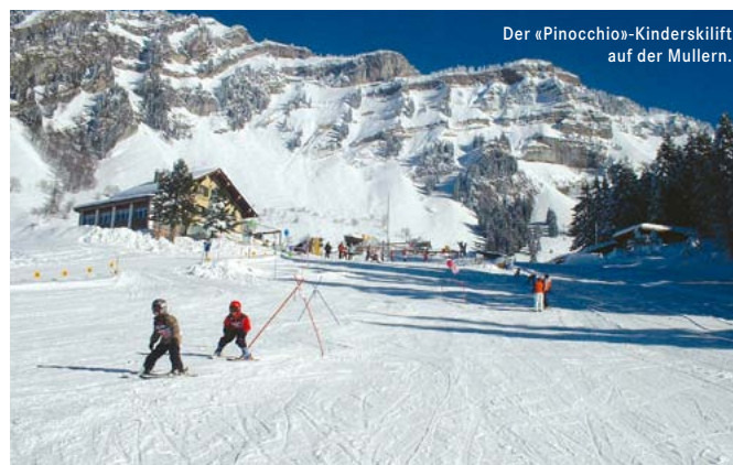
Der «Pinocchio»-Kinderskilift auf der Mullern.