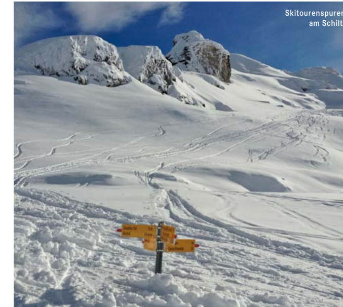
Skitourenspuren am Schilt.

Ab der Ranegg auf rund 1600 m Höhe erschliesst sich ein vielseitiges Skitourengebiet . Die Gipfel «Schilt», «Schwarzstöckli» und «Gufelstock» lassen sich auf verschiedenen Routen erreichen und bieten alle eine wunderbare Rundblick ins Glarnerland und die angrenzende Bergkulisse. Dank vieler Nordhänge ist das Gebiet für seine Pulverschneeabfahrten bekannt.