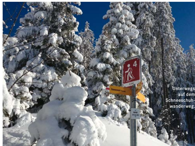
Unterwegs auf dem Schneeschuhwanderweg.

Langläufer finden auf der Mullern eine präparierte Loipe an sehr sonniger Lage mit Infrastruktur. Berggasthaus «Alpenrösli».