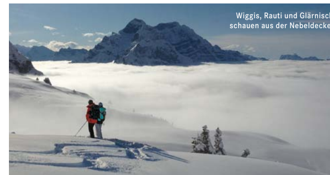
Wiggis, Rauti und Glärnisch schauen aus der Nebeldecke.