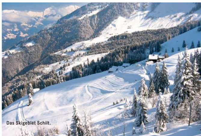
Das Skigebiet Schilt.

Details und Pistenbericht auf www.skiliftschilt.ch